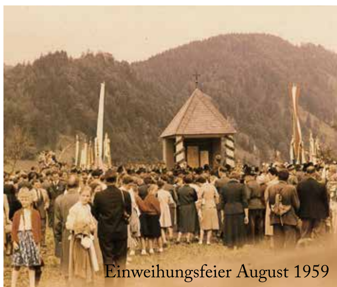
Einweihungsfeier August 1959