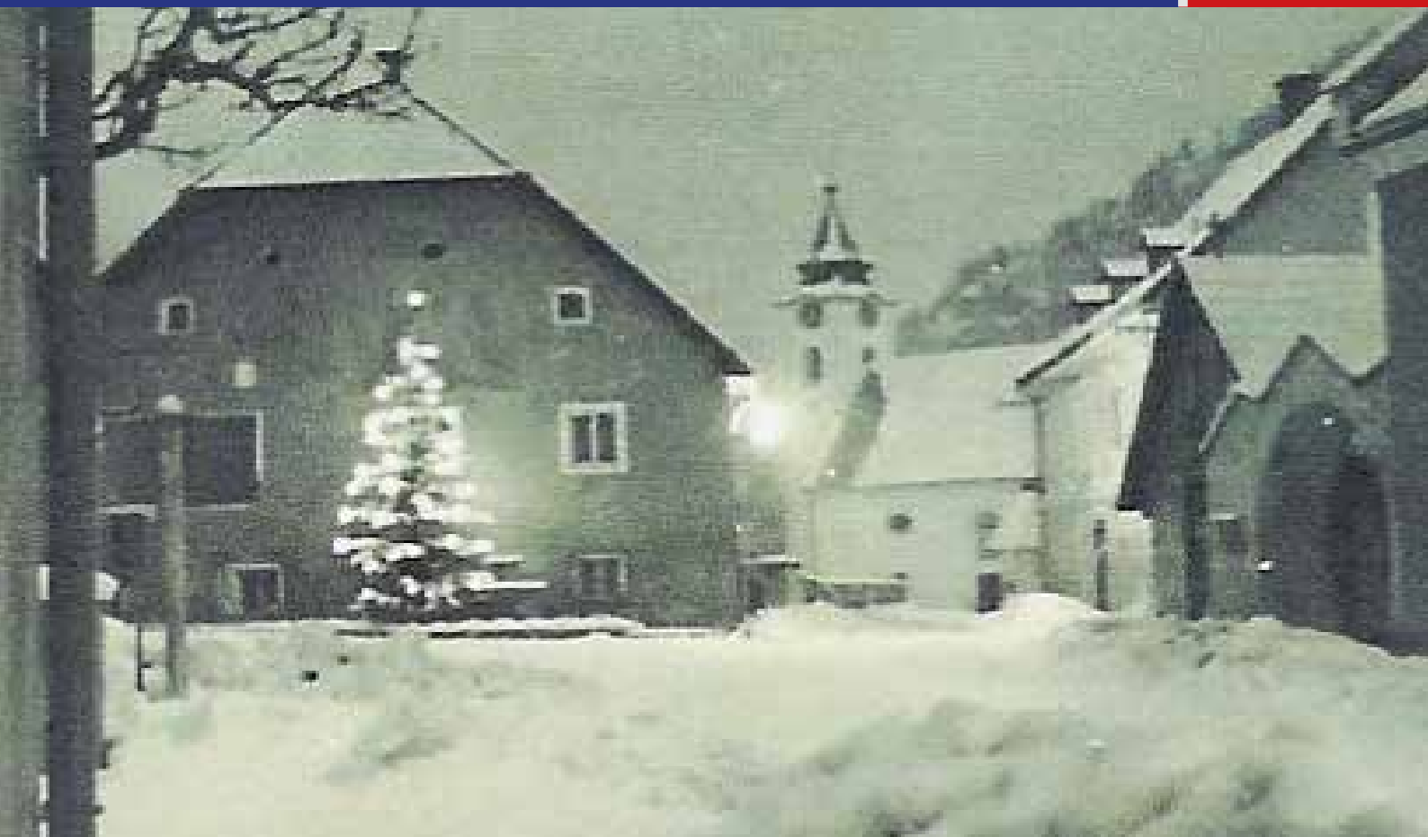
Altenmarkt um 1960

Amtliche Mitteilungen & Infos der Marktgemeinde Altenmarkt bei St. Gallen