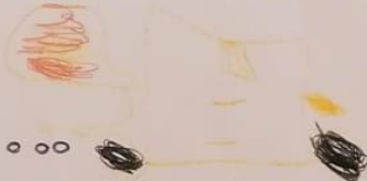
Traktor zum Mähen