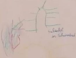
Schule im Schornberg