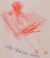
echte Post zum Lesen