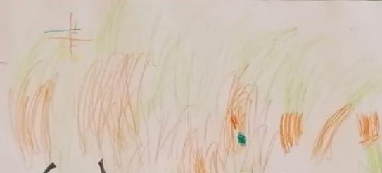
Turmperson im Wald